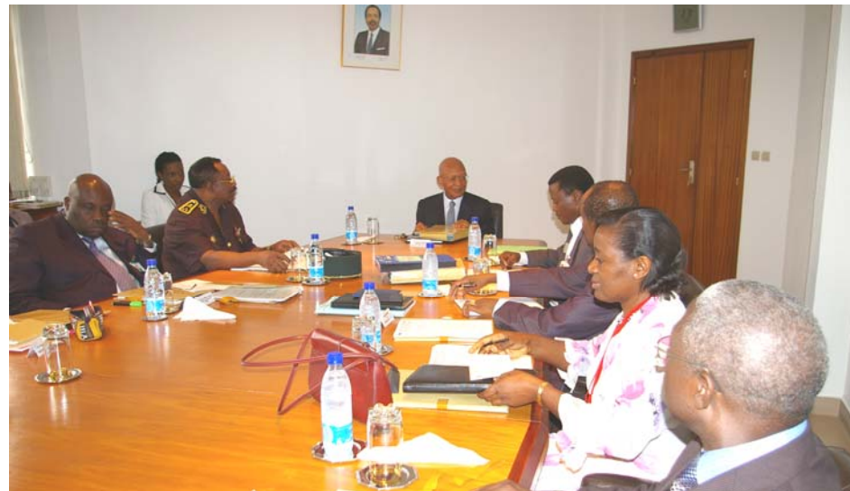
Les membres du Comité de Suivi réunis autour du Président du CPSP

Le 27 mai 2008 au siège social de la Société Nationale des Hydrocarbures (SNH), l'Administrateur Directeur Général de la SNH, Président du Comité de Pilotage et de Suivi des Pipelines (CPSP), a présidé la première Session Ordinaire du Comité de