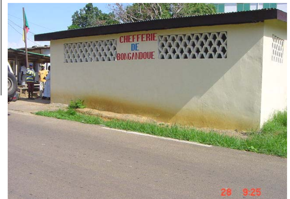
Case communautaire de Bongandoue, près de Kribi