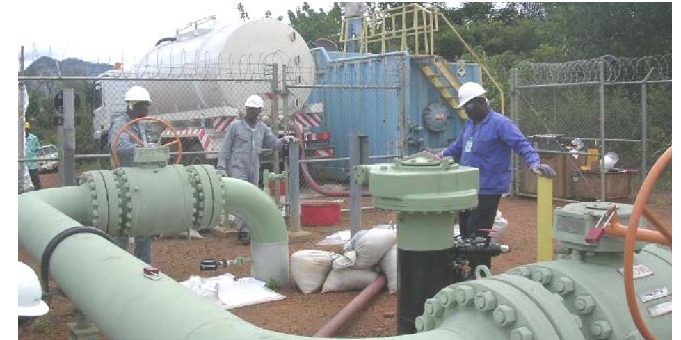
Des techniciens lors du test, au site de la vanne n° 36 (à Zoatoupsi)

Il ressort de cette revue que le système a pu détecter la fuite simulée, d'en déterminer exactement le volume et la localisation, avec une précision jugée satisfaisante. Ce qui a permis de conclure à sa fiabilité.