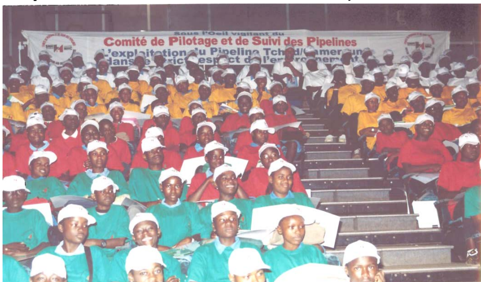
Les Jeunes, une priorité pour la sensibilisation par rapport à l'Environnement

Outre le débat qui a permis aux panélistes d'exprimer leurs points de vue sur les problèmes d'environnement, les téléspectateurs ont pu suivre avec intérêt trois reportages : le premier a permis d'apprécier dans quelle mesure l'environnement est une préoccupation pour l'homme de la rue ; le second a fait part de certaines expériences vécues en matière de prise en compte des préoccupations environnementales dans la vie quotidienne des populations ; tandis que le troisième rendait compte du suivi environnemental des activités du Pipeline Tchad/Cameroun par le CPSP.