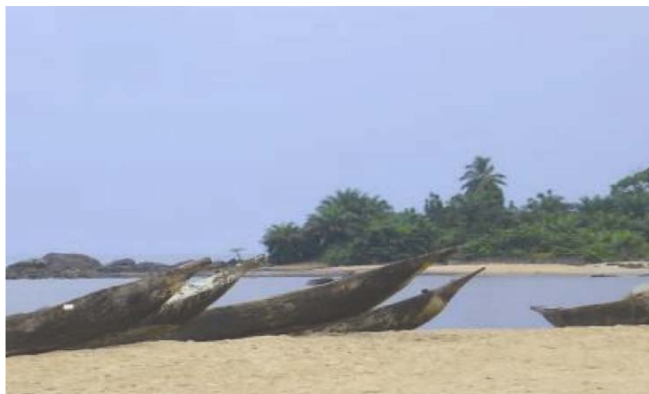
La protection de l'Environnement, une préoccupation majeure pour le CPSP et ses partenaires

Du 1 er janvier au 26 mai 2008, 22 enlèvements, pour un volume net cumulé de 18,9 millions de barils, ont été effectués, générant un droit de transit de 7,75 millions de dollars US, soit 3,3 milliards de francs CFA pour le Cameroun (1 dollar US = 427,04 F CFA). Ceci porte à 106,47 millions de dollars US, soit environ 54,49 milliards de Francs CFA, le montant total du droit de transit