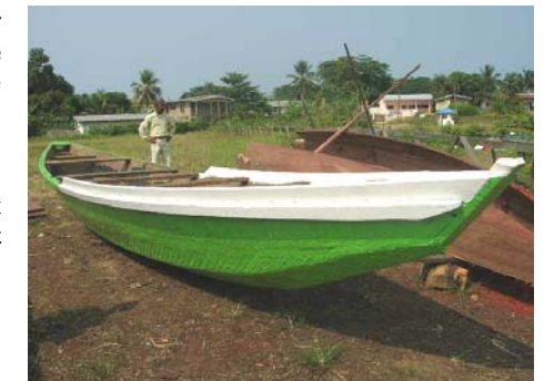
La pirogue à moteur

Il convient de rappeler que COTCO a alloué une enveloppe globale de 20 millions F CFA à l'ensemble de ces projets.