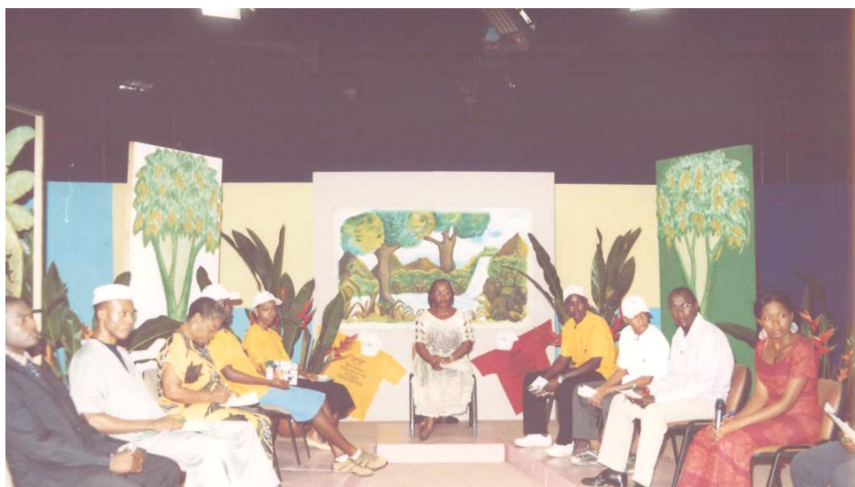
Une vue du plateau de l'émission décoré sur le thème de l'Environnement

Cette opération intervient dans le cadre du Projet de Renforcement de Capacités de Gestion Environnementale dans le Secteur Pétrolier au Cameroun (CAPECE).