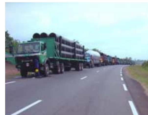
Les pipes sont acheminés du port de Douala, par route et par rail, vers les 9 aires de stockage situées le long de la portion camerounaise du tracé.

Le paiement des compensations aux individus touchés par les travaux de construction du pipeline, commencé en décembre 2000, est presque entièrement achevé. Les opérations se sont déroulées dans le cadre des Commissions Départementales créées à cet effet et présidées par les Préfets des localités concernées.