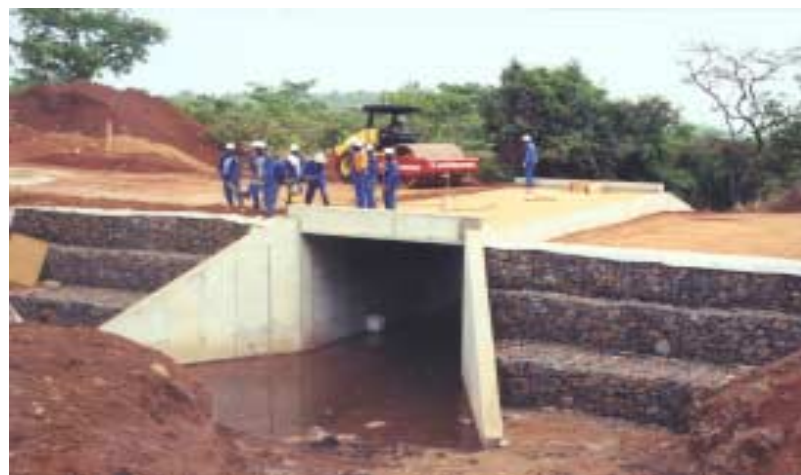
Travaux d'achèvement de construction d'un dalot sur la route Ngaoundal-Rivière Mbéré

Pour assurer le suivi de ces travaux, le CPSP dispose de 12 ingénieurs du génie civil venant des ministères des Travaux Publics et des Transports. La tâche de ces ingénieurs consiste à s'assurer que les normes admises au Cameroun pour la réalisation de telles infrastructures sont respectées pendant l'exécution des travaux: spécifications techniques y compris qualité des matériaux utilisés, mode d'exécution des travaux. En outre, ils assistent à toutes les réunions de chantier et participent aux réceptions provisoires et définitives des travaux.●