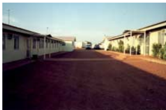
Des structures d'hébergement ont été aménagées le long du tracé du pipeline, à l'instar du camp ci-contre, situé à Bélel (Province de l'Adamaoua).

Ces équipes assurent la coordination, sur le terrain, des interventions des administrations concernées dans le cadre de la surveillance administrative et du contrôle technique des activités du Projet. •