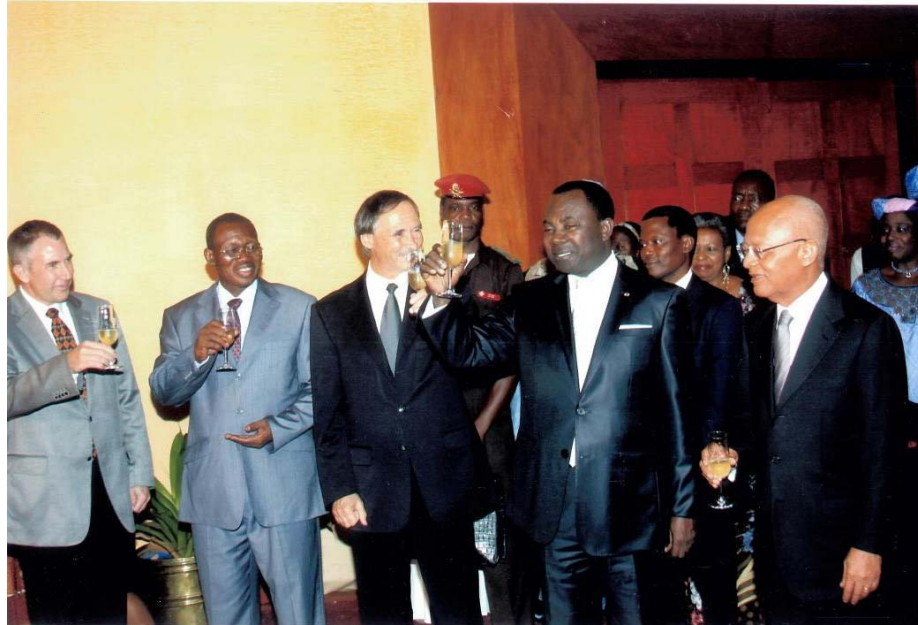
Le toast au DG sortant avant de recevoir sa médaille