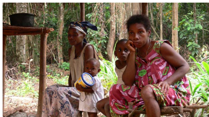
Les peuples vulnérables autochtones, une des cibles privilégiées des actions de la FEDEC

La Lettre du CPSP est réalisée par le Secrétariat Permanent du Comité de Pilotage et de Suivi des Pipelines