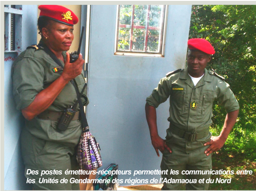
Des postes émetteurs-récepteurs permettent les communications entre les Unités de Gendarmerie des régions de l'Adamaoua et du Nord

Cette réception, qui a eu lieu le 23 août 2016 en présence d'un représentant du CPSP, a consisté à tester la fonctionnalité effective de l'interconnexion des réseaux de transmission VHF (Very High Frequency) entre les unités de Gendarmerie de Ngaoundéré et Touboro, suite à l'installation par CAMTEL de la fibre optique reliant ces deux localités.