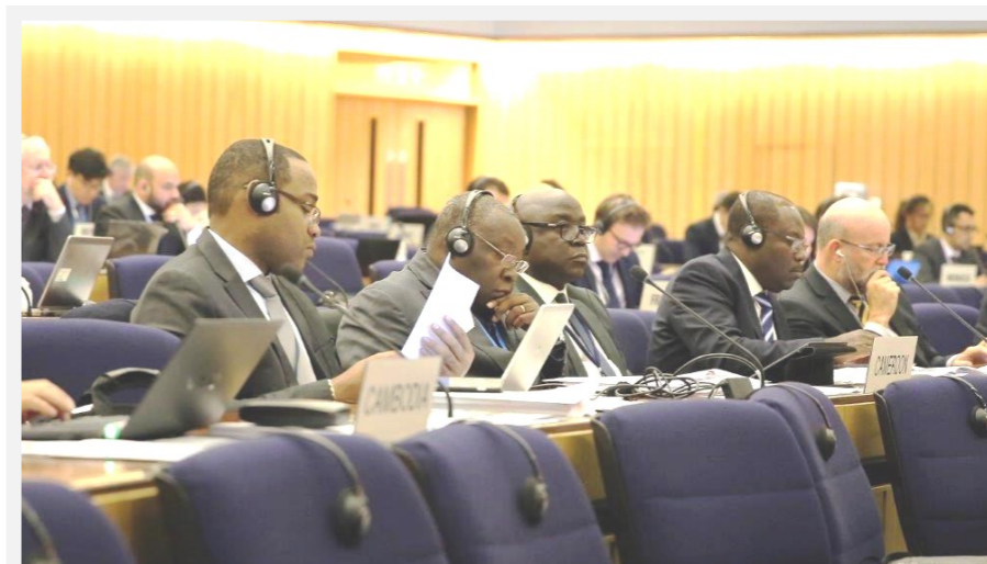
La délégation camerounaise au premier plan lors d'une réunion des FIPOL

Le Comité de Pilotage et de Suivi des Pipelines était représenté par deux responsables à ces assises qui se sont tenues du 17 au 20 octobre 2016 à Londres.