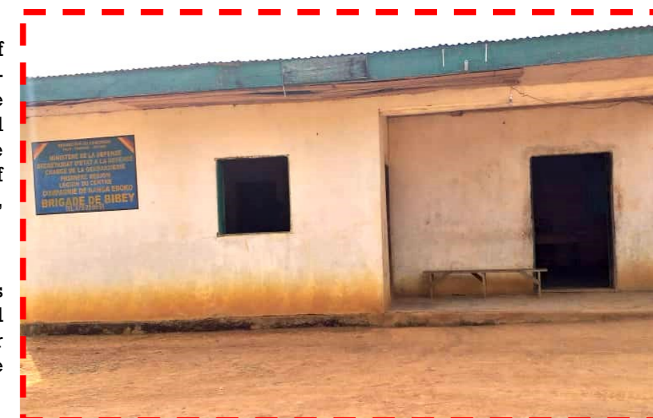
The old building of the Bibey Gendarmerie Brigade

After the ceremony, the keys of the Brigade were handed over to the Commander for immediate occupation of the premises.