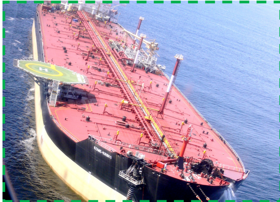
Les enlèvements au Terminal Komé-Kribi 1 (KK1) en hausse

Les travaux de la première session du Comité de Suivi du CPSP de cet exercice se sont déroulés du 22 au 29 mai 2020, sous la formule d'une Consultation à domicile, en raison de la pandémie du COVID-19.