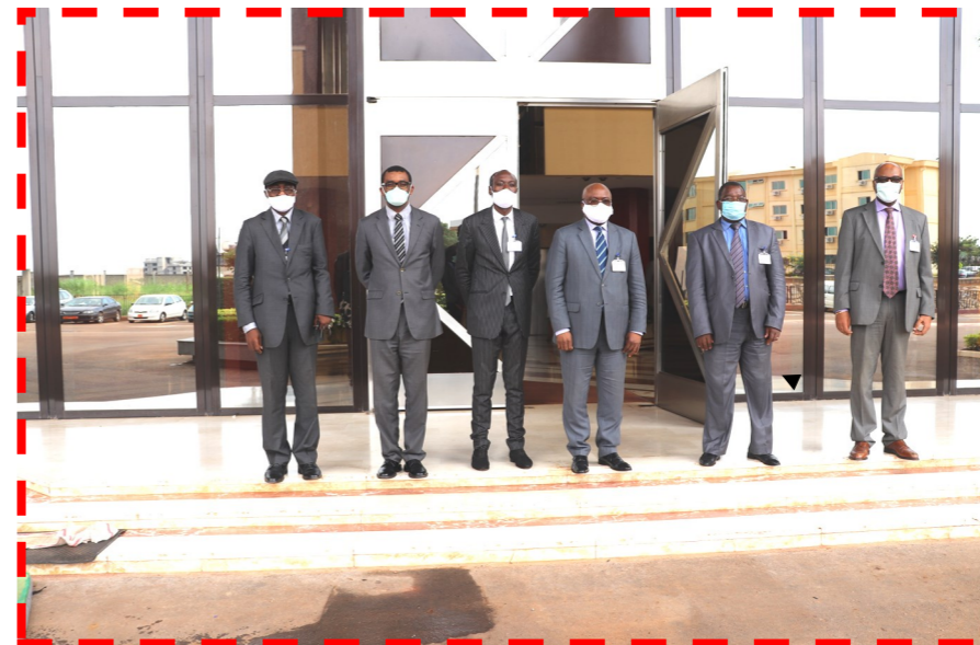
The new Permanent Secretary of the PSMC (2 nd from the left) after the handing over in the presence of the representative of the Chairman of the PSMC (4 th from the left)