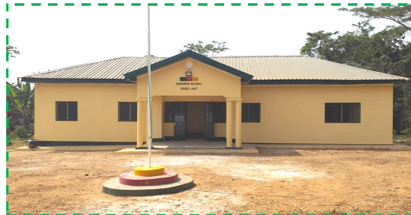
Le nouveau bâtiment de la Brigade de Gendarmerie de Bibey

La réception provisoire du bâtiment de la Brigade de Gendarmerie de Bibey, située dans le département de Haute-Sanaga, construit avec l'appui du Comité de Pilotage et de Suivi du Pipeline (CPSP) dans le cadre de la