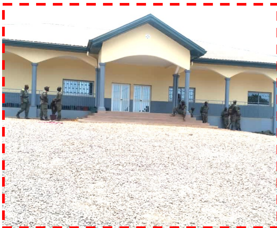
Road developed with the support of the PSMC

The provisional and technical acceptance of the works to increase the capacity of the Centre de Perfectionnement aux Techniques de Maintien de l'Ordre (CPTMO) of the National Gendarmerie, located in Awaé, Mefou and Afamba division, took place on March 13, 2020.