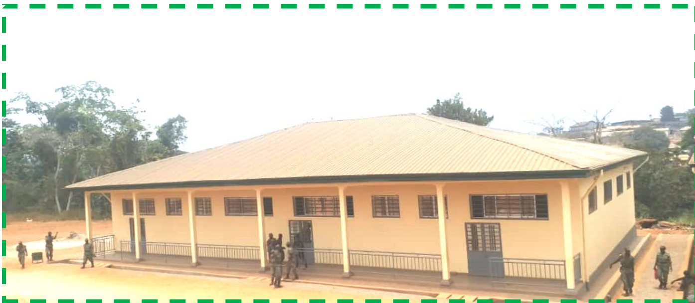
Salles de classes construites avec l'appui du CPSP

La réception provisoire et technique des travaux de relèvement de la capacité d'accueil du Centre de Perfectionnement aux Techniques de Maintien de l'Ordre (CPTMO) de la Gendarmerie Nationale, situé à Awaé, département de la Mefou et Afamba, a eu lieu le 13 mars 2020.