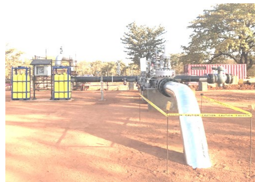
OPIC connection point to the Chad / Cameroon Pipeline

The transportation contract between Chad Oil Transportation Company (TOTCO)/Cameroon Oil Transportation Company (COTCO)