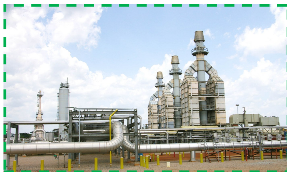
Pump station of Belabo

The Board also acknowledged the Management Report of the company and the Auditor's Report in